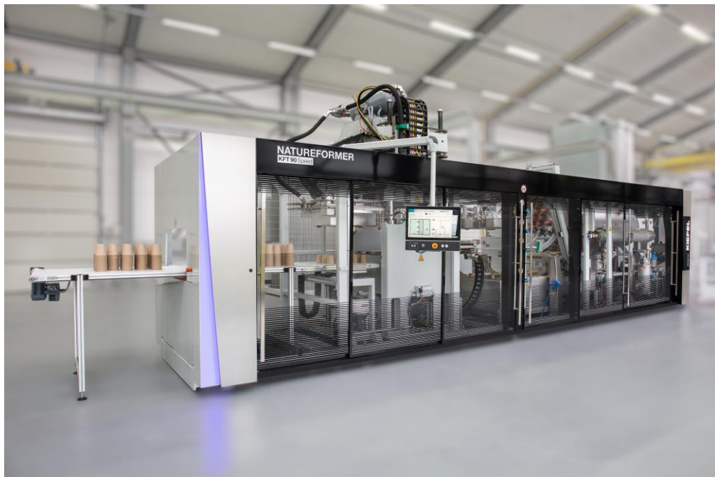
Die Maschinenserie NATUREFORMER KFT hat es bereits beim Deutschen Nachhaltigkeitspreis Design unter die Finalisten geschafft.